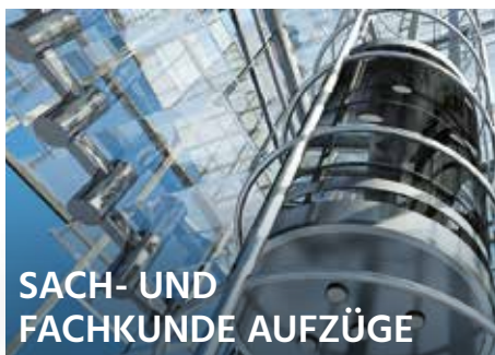
SACH- UND FACHKUNDE AUFZÜGE

► Hybrid-Seminar (Online Teilnahme möglich) Ausbildung zum Sicherheitsbeauftragten Auf Grundlage des SGB VII und der DGUV Vorschrift 1 12.02.2025 – 13.02.2025, Essen www.hdt.de/VA25-00280 24.06.2025 – 25.06.2025, Essen www.hdt.de/VA25-00281 ► Hybrid-Seminar (Online Teilnahme möglich) Weiterbildung für Sicherheitsbeauftragte und Fachkräfte für Arbeitssicherheit (§22 SGB VII) und DGUV Vorschrift 1 08.05.2025, Essen www.hdt.de/VA25-00378