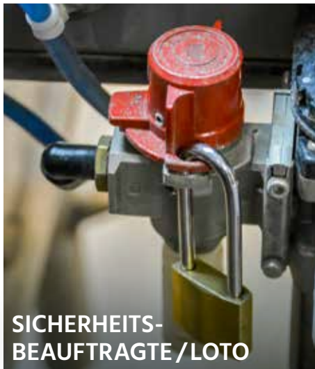
SICHERHEITS- BEAUFTRAGTE / LOTO

► Hybrid-Seminar (Online Teilnahme möglich) NEU Digitale Betriebsanleitung Auf Grundlage der Maschinenverordnung (EU) 2023/1230 und der Maschinenrichtlinie 2006/42/EG 25.03.2025 – 26.03.2025, Essen www.hdt.de/VA25-01012